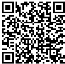
関西電力送配電ホームページ QRコード

※取付けを希望される場合、別途費用が関西電力送配電から請求されます。 なお、当該引込線以外への防護管工事は関西電力送配電では対応されていないので、防護管施工業者へ直接お申込みが必要となります。(別途費用発生) 当申込によらない引込線への取付けについても同様です。 施工業者については関西電力送配電のホームページをご確認ください。