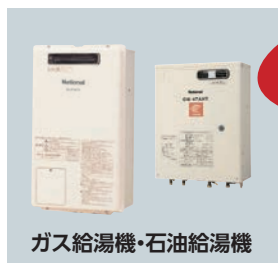
ガス給湯機・石油給湯機